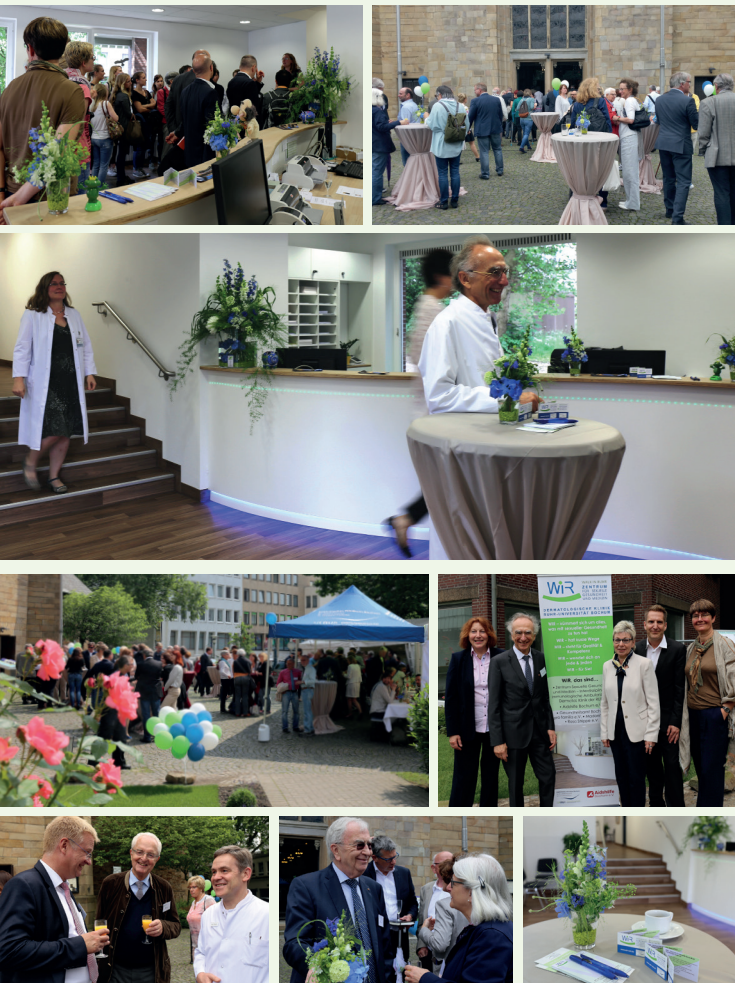
Bilder der Eröffnungsfeier WIR 2016:

ANSCHRIFT WIR – Walk In Ruhr Zentrum für Sexuelle Gesundheit und Medizin Große Beckstr. 12 in 44787 Bochum Am St. Elisabeth-Hospital